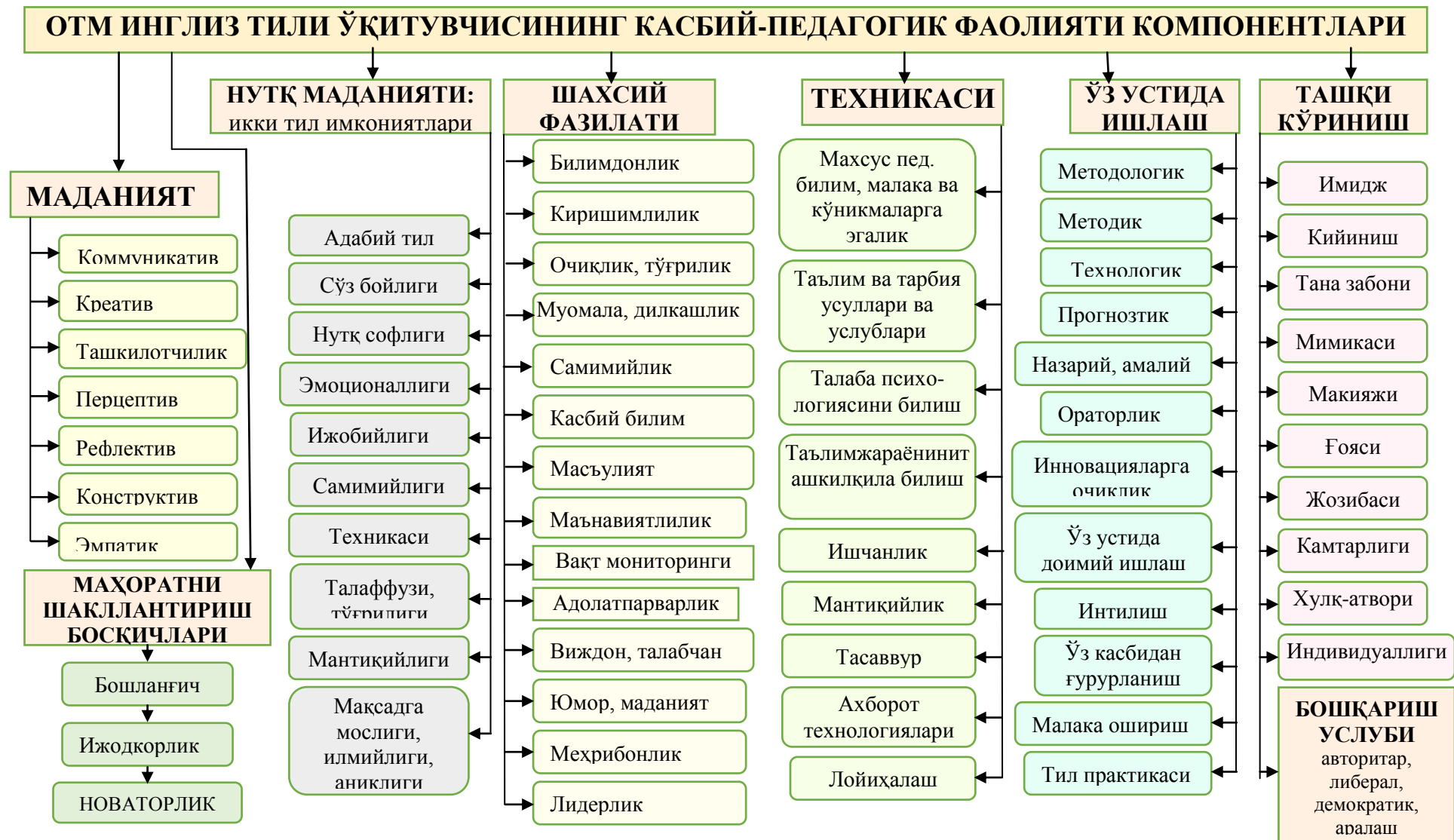
1-расм. Олий таълим муассасаси инглиз тили ўқитувчисининг касбий-педагогик фаолияти тузилмаси