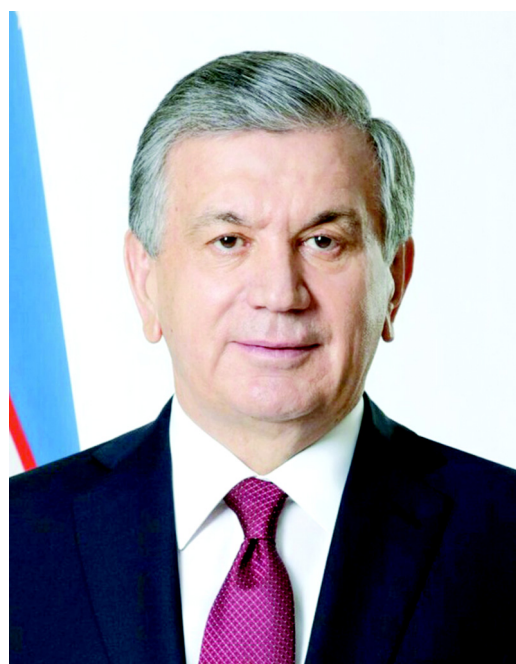
Шавкат Мирзиёев Ўзбекистон Либерал-демократик партияси томонидан