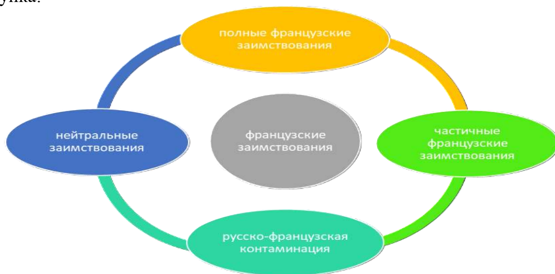
Рисунок 1. Виды французских заимствований

4. Нейтральные заимствования, которые включены в русский текст, но представлены с переводом. Их можно представить в виде следующего рисунка: