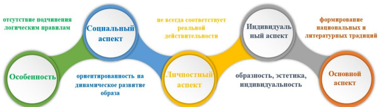
Рисунок 1. Характеристики и описание художественной концепции

Например: “ If he’d of lived he’d of been a great man . A man like James J.Hill. He’d of helped build up the country ” [Fitzgerald. Great Gatsby: 179]; “ After that I felt a certain shame for Gatsby – one gentleman to whom I telephoned implied that he had got what he deserved. However, that was my fault, for he was one of those who used to sneer most bitterly at Gatsby on the courage of the Gatsby’s liquor and I should have known better than to call him ”